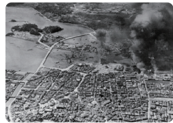
10・10空襲時の那覇港および旧那覇市街 1944年10月10日